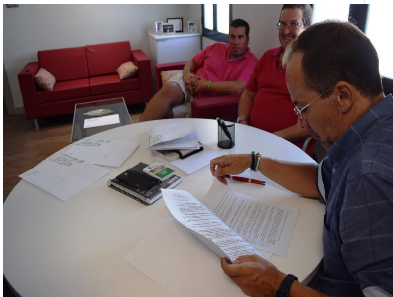
( http://www.hinojos.es/export/sites/hinojos/es/.galleries/noticias/noticias2017/109.-FIRMA-CLUBES-DEPORTIVOS-2.JPG )