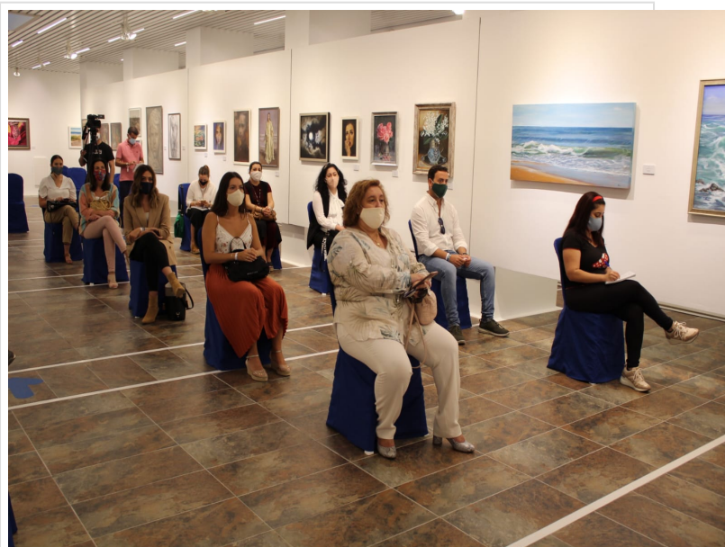
( http://www.hinojos.es/export/sites/hinojos/es/.galleries/noticias/noticias2020/20200920_IgualesContraLaDesigualdad-2.jpg )

Todas las acciones han sido pensadas para adaptarse a la realidad de los municipios y a las características de los principales públicos objetivos del proyecto: hombres y mujeres de más de 25 años, población juvenil de 18 a 25 años y alumnado de secundaria de los 10 municipios que participan en esta innovadora iniciativa.