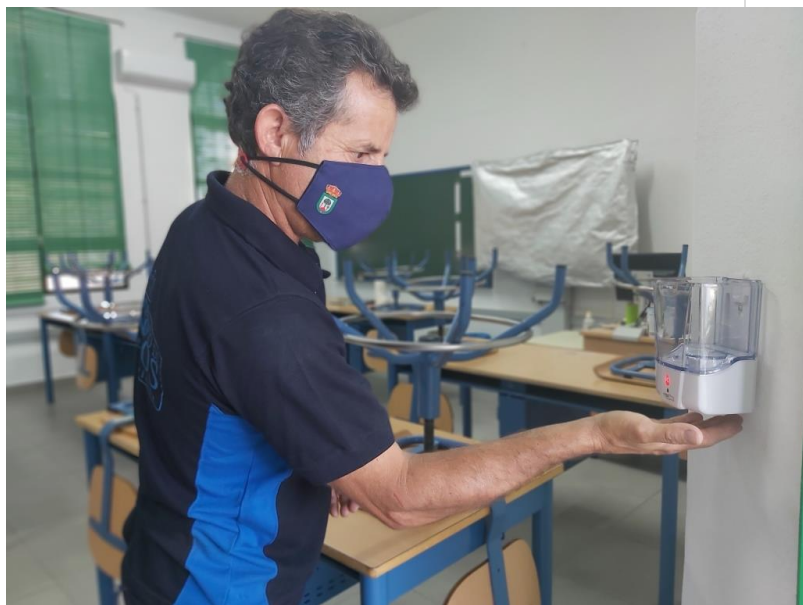
( http://www.hinojos.es/export/sites/hinojos/es/.galleries/noticias/noticias2020/20201113_MaterialCovid-3.jpg )