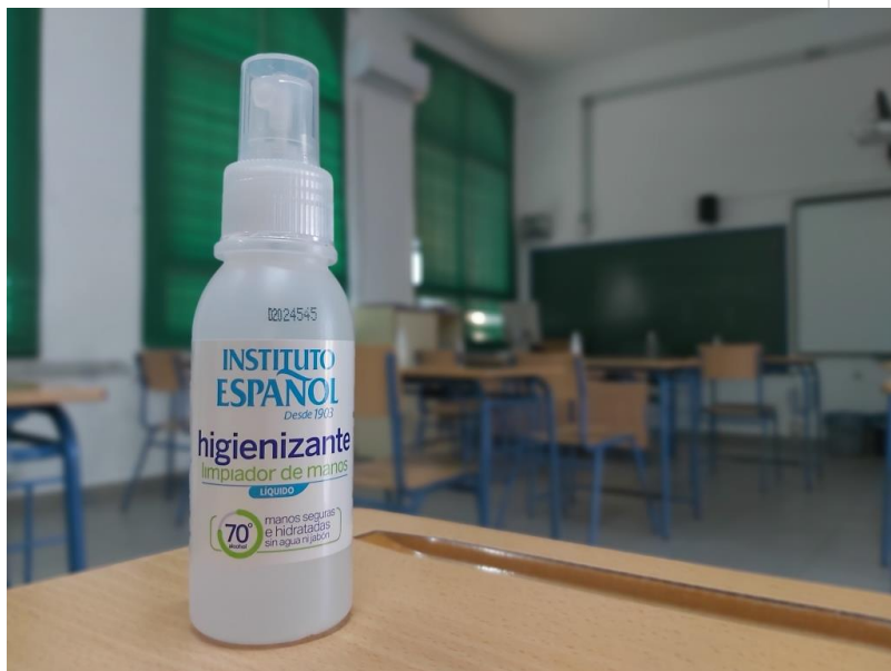
( http://www.hinojos.es/export/sites/hinojos/es/.galleries/noticias/noticias2020/20201113_MaterialCovid-1.jpg )