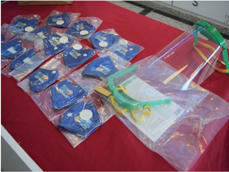
( http://www.hinojos.es/export/sites/hinojos/es/.galleries/noticias/noticias2020/20201113_MaterialCovid-5.JPG )