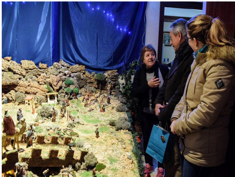
( http://www.hinojos.es/export/sites/hinojos/es/.galleries/noticias/noticias2018/121218_RUTA_BELENES.jpg )