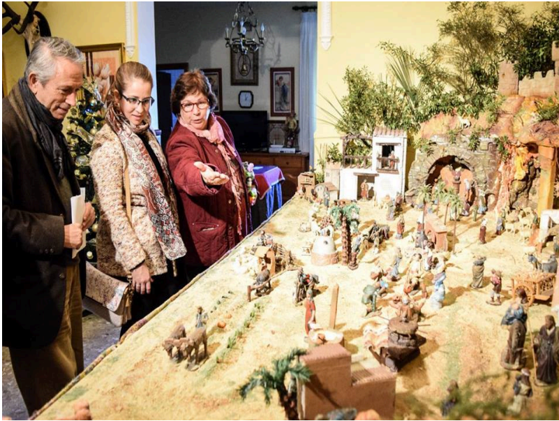
( http://www.hinojos.es/export/sites/hinojos/es/.galleries/noticias/noticias2018/121218_RUTA_BELENES4.jpg )