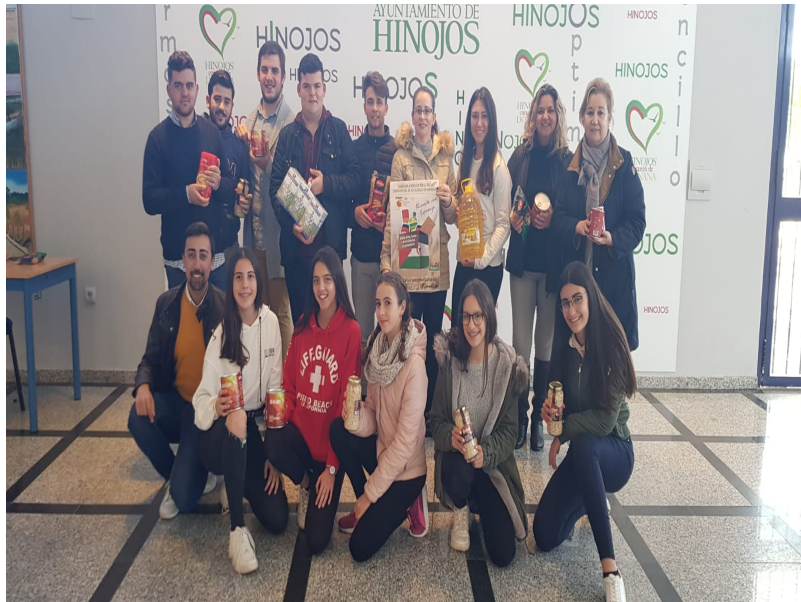
( http://www.hinojos.es/export/sites/hinojos/es/.galleries/noticias/noticias2019/040219_AYUDA_SAHARA-1.jpg )