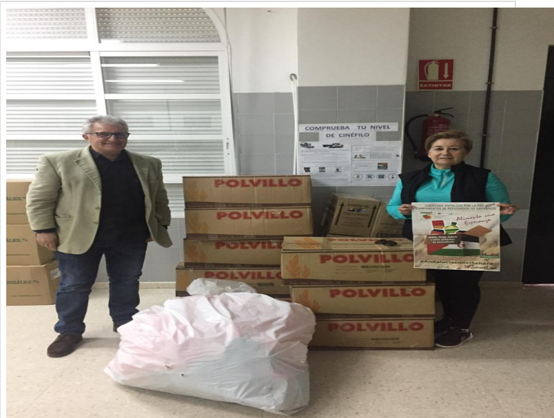
( http://www.hinojos.es/export/sites/hinojos/es/.galleries/noticias/noticias2019/040219_AYUDA_SAHARA.jpg )