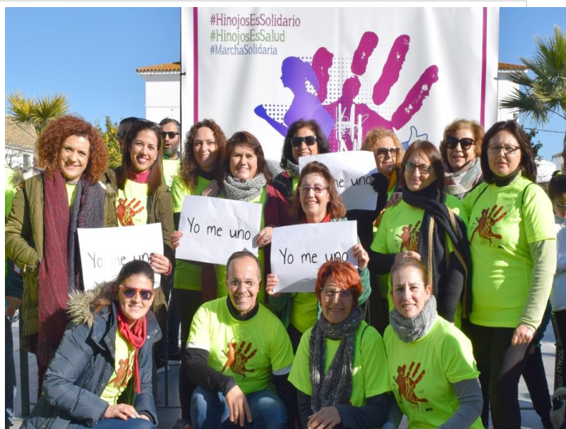
( http://www.hinojos.es/export/sites/hinojos/es/.galleries/noticias/noticias2020/20200124_MARCHA_SOLIDARIA.JPG )

Asimismo, el Ayuntamiento de Hinojos, como organizador la actividad, ha sentido el apoyo de la Diputación de Huelva, y la colaboración de Doñana Trail Marathon, Catering de Tena Ortiz, Club Deportivo Hinojos y Docarilo.