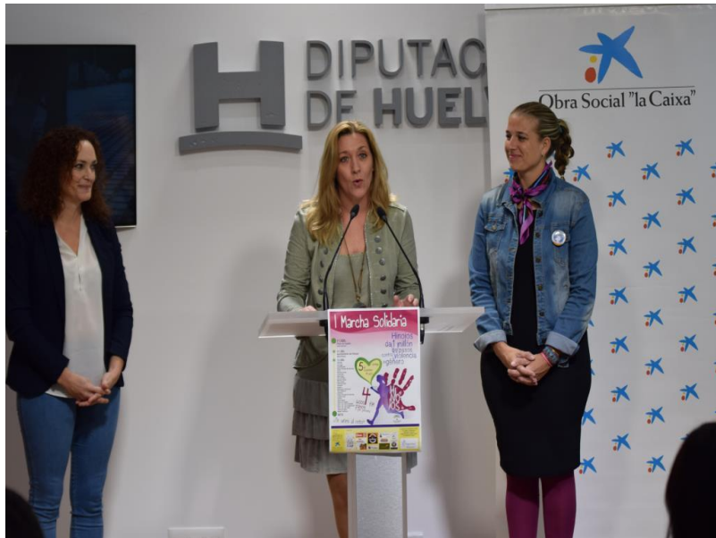
( http://www.hinojos.es/export/sites/hinojos/es/.galleries/noticias/noticias2017/133.-MARCHA-SOLIDARIA-DIPUTACION-3.JPG )