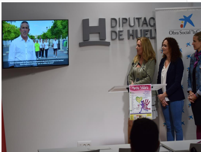
( http://www.hinojos.es/export/sites/hinojos/es/.galleries/noticias/noticias2017/133.-MARCHA-SOLIDARIA-DIPUTACION-4.JPG )