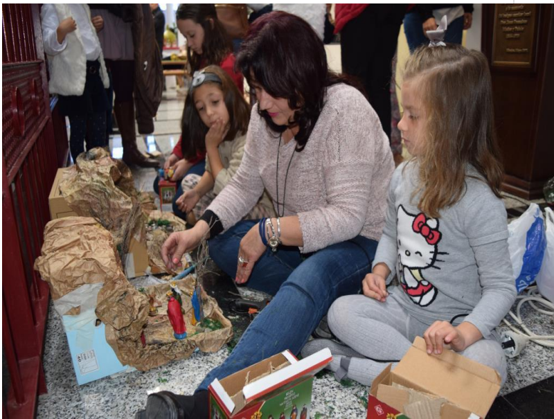
( http://www.hinojos.es/export/sites/hinojos/es/.galleries/noticias/noticias2018/112618_MERCADILLO_NAVIDENO-2.JPG )