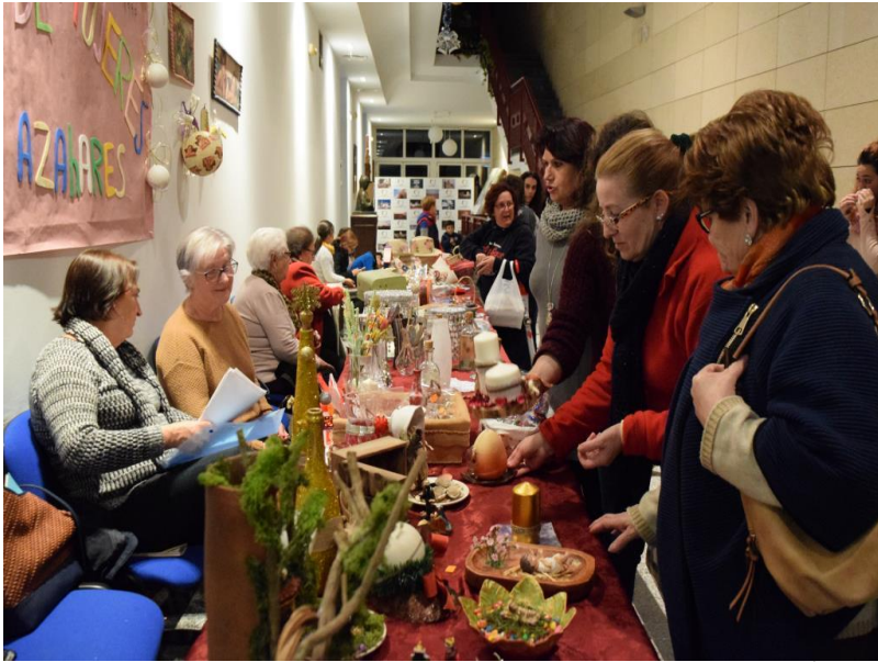
( http://www.hinojos.es/export/sites/hinojos/es/.galleries/noticias/noticias2018/112618_MERCADILLO_NAVIDENO-4.JPG )